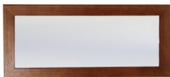
Зеркало в рамке

ГАРАНТИЙНЫЙ СРОК - 24 месяца со дня приобретения СРОК СЛУЖБЫ при правильной эксплуатации - не менее 10 лет Почта для отзывов: bez-braka@mail.ru